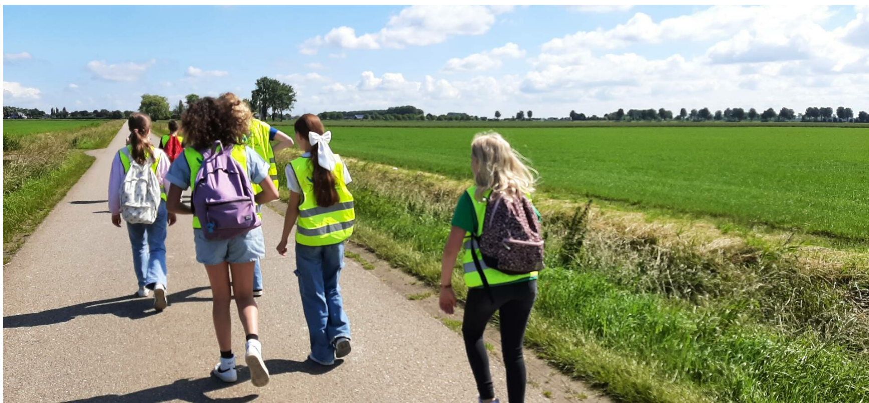
Wandelen voor water

Verder leren we de kinderen op een actieve manier zorg te dragen voor hun omgeving en het milieu. We scheiden op school ons afval en er vinden regelmatig gastlessen plaats over recyclen. Daarnaast doet groep 7 jaarlijks mee met de e-waste race, waarbij ze elektronisch afval inzamelen om dit te laten recyclen.